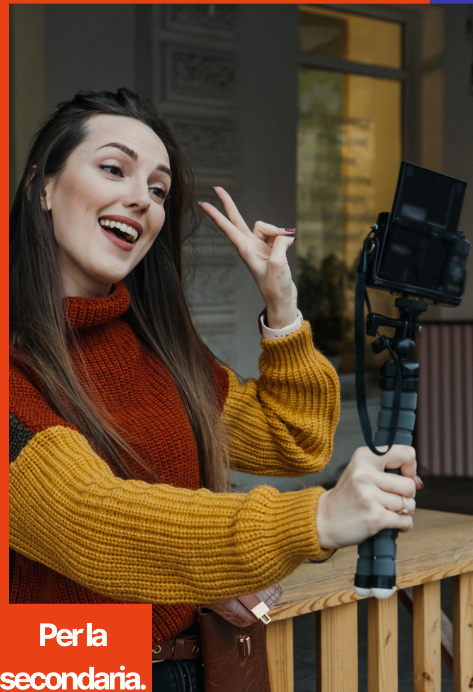
Per la secondaria. 20 ore